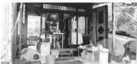
直方がんだびっくり市で 月1回開催される フリーマーケットにも 出店しています！